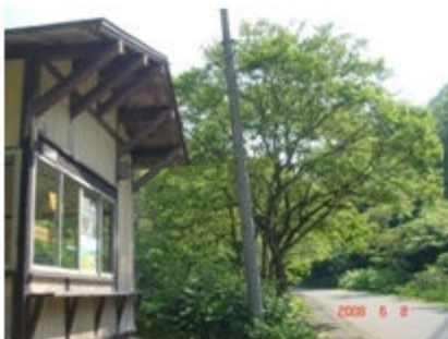
サワグルミコース入口